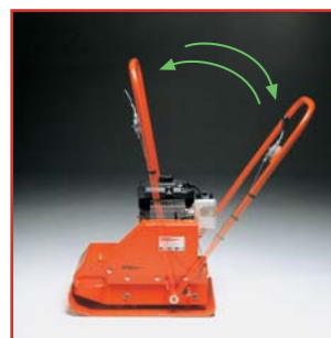
Impugnatura mobile Movable handle