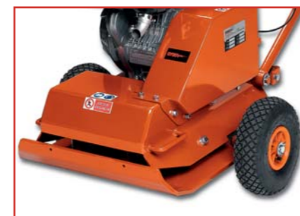
Coppia ruote per il trasporto in dotazione Equipped with a pair of transport wheels