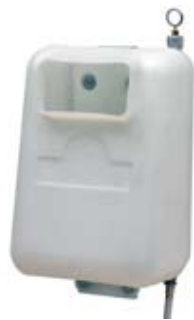
103 M SERBATOIO POLIETILENE 12 lt (3,17 gal) POLYPROPYLENE TANK 12 litres (3,17 gal)