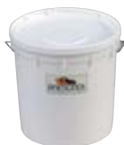
130CRISTPG POLVERE LUCIDANTE PER GRANITO (SECCHIO 5 Kg) POLISHING POWDER FOR GRANITE (BUCKET CAPACITY Kg 5) 130CRISTPM POLVERE LUCIDANTE PER MARMO E CEMENTO (SECCHIO 5 Kg) POLISHING POWDER FOR MARBLE AND CEMENT (BUCKET CAPACITY Kg 5)