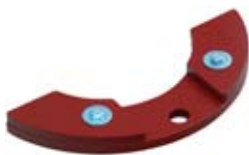
219ZV01A KIT ZAVORRE 5,9 Kg (13 lbs) BALLASTS KIT 5,9 Kg (13 lbs)