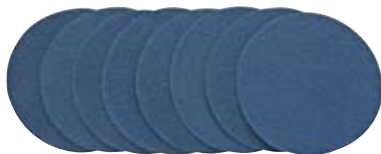
274CV100G24 274CV100G40 274CV100G60 274CV100G80 274CV100G100 274CV100G120 DISCO ABRASIVO IN ZIRCONIO CON ATTACCO VELCRO Ø 115mm ZIRCONIUM ABRASIVE DISCS WITH VELCRO ATTACHMENT Ø 115mm